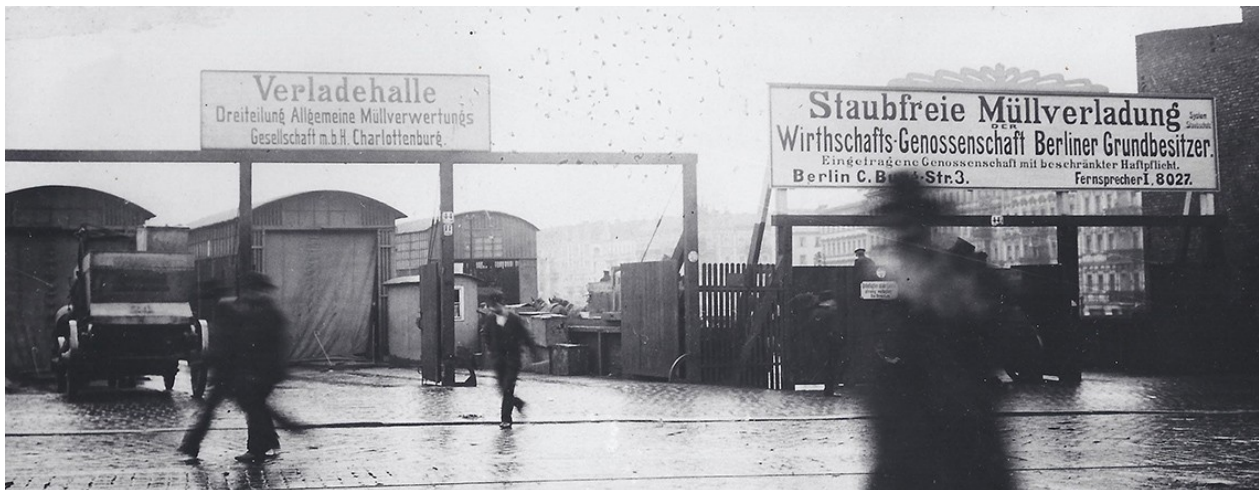
Verladestellen in Charlottenburg 1910

Auch in den folgenden Jahren kam die „Dreiteilung“ nicht aus den roten Zahlen heraus. Nach den technischen Anfangsschwierigkeiten bereitete die mangelhafte Sortierfreude der Haushalte Verdruss. Die in die falschen Behälter geworfenen Abfälle verursachten zusätzlichen Aufwand in der Sortieranlage.