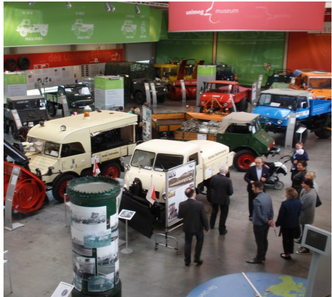
UNIMOG Museum Gaggenau

Die Schneefräse wird ab Oktober in der Ringbahnstr. in unserer Ausstellung zu besichtigen sein, bevor sie wieder ins Depot des DTMB rollt. Leider kann sie zum Museumstag noch nicht in Berlin sein.