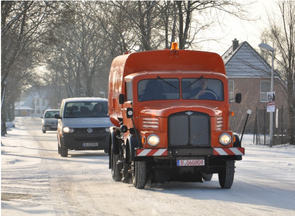
Auf Achse in Trebbin