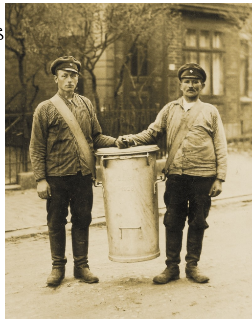
Eine frühe Ringtonne 1929 in Lübeck

Wer die letzte INTERN, die Betriebszeitung der BSR gelesen hat, weiß es schon. Allen anderen sei die sehenswerte Ausstellung im Vorraum der BSR-Kantine in der Ringbahnstraße mit Müllbehältern im Wandel der Zeiten ausdrücklich ans Herz gelegt. Die wirklichen Schätze liegen ja oft unerkant in irgendeiner Ecke des Betriebes. Erst die gezielte Suche und das Zusammenstellen in einem geschichtlich interessanten Kontext macht eine Sache spannend und ausstellungswürdig. Wir