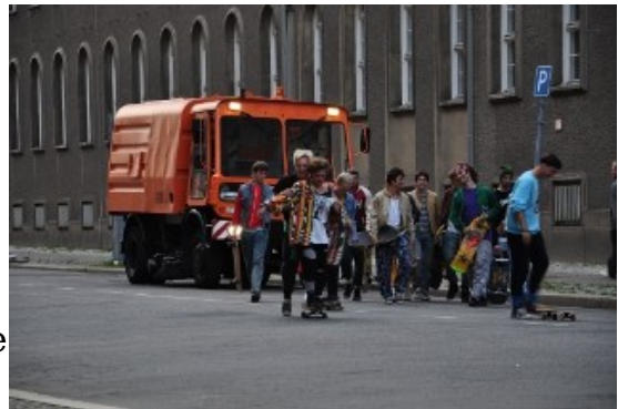
Aufnahme in der Klosterstraße

Aufmerksame Leser können sich vielleicht noch an die Teilnahme unserer Kehrmaschine 2301 an den Dreharbeiten zum Film „This ain't California“ im August 2011 erinnern (der Newsletter berichtete). Der Film hat bei der Berlinale 2012 den Preis des Deutsch-französischen