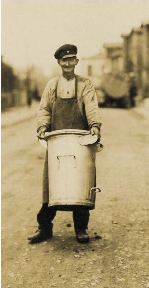
Sehr voll ist die Tonne offenbar nicht

sind der (einzige) Verein, der sich der Geschichte von Straßenreinigung und Müllabfuhr widmet und wollen mit kleinen wechselnden Ausstellungen dieses wichtige Geschäft im täglichen Getriebe einer großen Stadt beleuchten. Diesmal sind es die Müllbehälter und Papierkörbe und ihr gewandeltes Erscheinungsbild in den letzten Jahrzehnten.