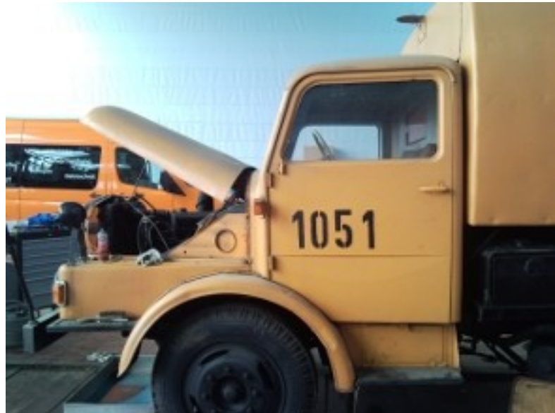
2010 im März in der Hauptwerkstatt Ringbahnstraße

Wir schafften es, unter großer Beteiligung des Kollegen Karsten Korinth das Fahrerhaus fast komplett zu restaurieren. Im August 2010 kam dann leider das Aus für die Arbeiten an der S4000-1 innerhalb der BSR. Die BSR unterstützte ab sofort den Verein Saubere Zeiten e.V. im