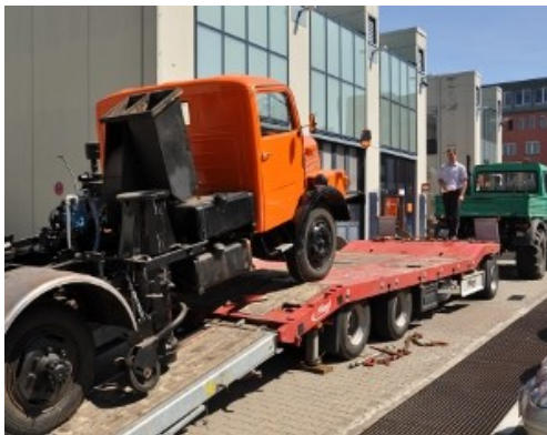
Auf Transport nach Trebbin

Rahmen einer Kooperationsvereinbarung bei der weiteren Instandsetzung – außerhalb der BSR.