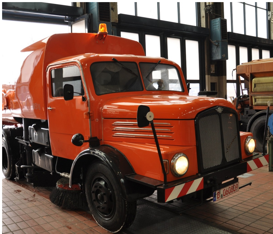
Blitzblank und technisch fit zurück in der Ringbahnstraße

Jetzt steht sie, komplett einsatzbereit wie am ersten Tag, im Ausstellungsraum und kann von allen bestaunt werden.