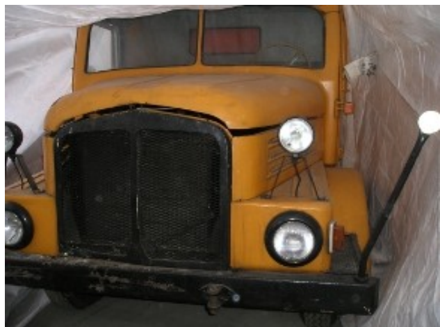
Im März 2006 unter einer Folie geschützt in der Gradestraße

1966 ist aber auch das Baujahr einer Kehrmaschine die auf einem Fahrgestell S4000-1 aufgesetzt wurde. Das einzige in Deutschland (auf der Welt?) noch erhaltene Exemplar steht jetzt im Ausstellungsraum unseres Vereins, im Vorraum der BSR-Kantine.