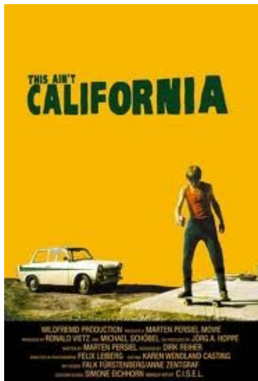
Ab August im Kino

Jugendwerks „Dialogue en Perspective“ erhalten. Eine herzliche Gratulation an die Filmmacher mit dem Regisseur Marten Persiel an der Spitze!